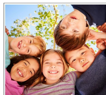
Ganztagsförderung in Mainz

(ob dieses perspektivisch durch einen "Freien Träger der Jugendhilfe" oder die "Betreuende Grundschule" durchgeführt wird).